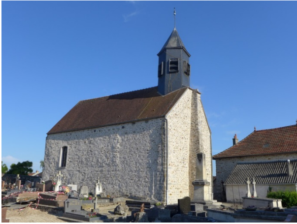
13. L'aqueduc de la Vanne et du Loing : une voie directe vers le sud de l'Essonne