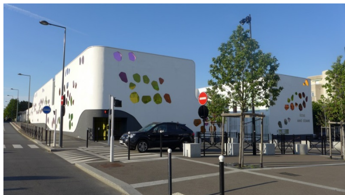
21. L'architecture colorée de l'école Aimée Césaire

Après être revenus sur vos pas pour passer le pont de l'A6 puis à nouveau dans le parc de Coquibus, vous emprunterez une rue calme en double sens cyclable, la rue Boissy d'Anglas. Observez au passage l'architecture colorée de la nouvelle école primaire Aimée Césaire.