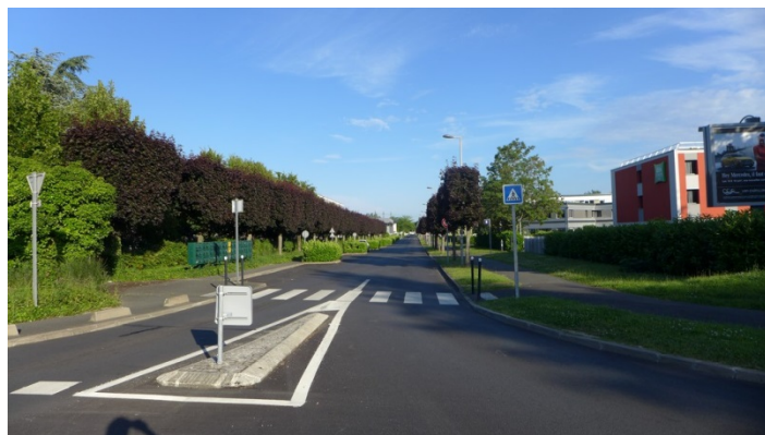
20. Le parc d'activités de la petite montagne : une route confortable pour le retour

Pour retourner sur Evry, le plus simple est d'emprunter la rue du Bois Chaland, qui traverse le parc d'activités de la Petite montagne. Bien que dépourvue d'aménagement cyclable, son faible trafic et son revêtement confortable sont appréciables.