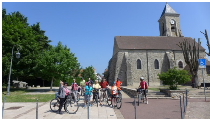
18. L'allée du Bois des folies, une voie verte de Bondoufle à Lisses

Bondoufle, à peine plus grand que son voisin de Courcouronnes en 1968, avec 285 habitants, avant de bondir à plus de 8000 en 1990. Face à la vieille église St Denis et St Fiacre, l'hôtel de ville, aménagé dans les bâtiments d'une ancienne ferme