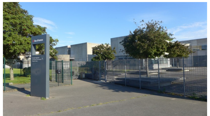
16. Le lycée François Truffaut à Bondoufle

Après une entrée un peu compliquée dans la ville de Bondoufle, vous traversez par une allée piétonne les installations sportives attenante au lycée François Truffaut, un des grands lycées de l'agglomération.