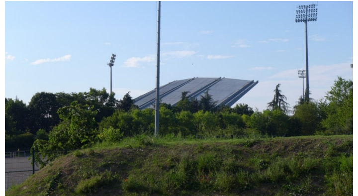
15. Le stade Robert Bobin et ses équipements sportifs

Repérable de loin par sa grande toiture lancée au-dessus des tribunes sans aucun poteau, le stade Robert Bobin a été construit en 1993 pour les Jeux de la francophonie de 1994. C'est un complexe omnisports comprenant une piste d'athlétisme, un terrain de football et de rugby. Sa capacité se monte à 18 850 places assises, dont 4 500 couvertes, ce qui en fait le 5° plus grand stade d'Île-de-France.