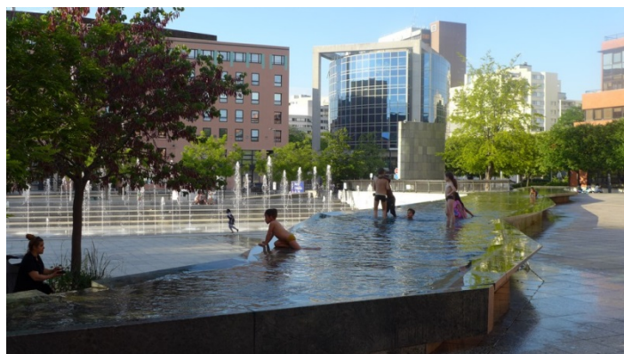
22. Jeux d'eau sur la place des Droits de l'Homme

Pour finir, avant de rejoindre la gare, s'il fait chaud, les enfants pourront profiter des jets d'eau sur la place des Droits de l'Homme, au pied de l'Hôtel de ville et de la cathédrale.