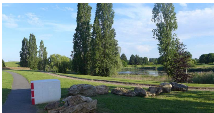
19. Le parc Léonard de Vinci : un parc d'activités entouré de bois et d'espaces verts

Arrivés sur Lisses, sur une étroite piste cyclable, vous longez le parc Léonard de Vinci, avec son lac en forme de cœur, entouré de bois et d'un parc d'activités. Comme celui de Courcouronnes, il a été créé à l'origine pour le stockage et la régulation des eaux pluviales puis aménagé en espace de détente, proposant des activités sportives gratuites.