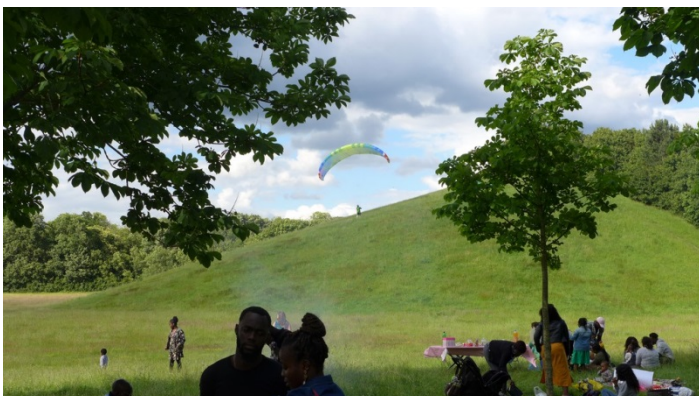
14. Le parc du rondeau et ses deux collines : vastes prairies, calme et vol à voile.

Le parc du Rondeau, traversé par une des sources de l'Écoute s'il pleut, est appelé par les habitants des alentours «les deux dunes » ou d'autres images suggestives.... En effet il contient deux buttes de 15 m de haut, couvertes pour moitié de bois et pour moitié d'herbe, seuls reliefs au-dessus du plateau de la Brie. Entre les deux, une grande prairie propice aux pique-niques.